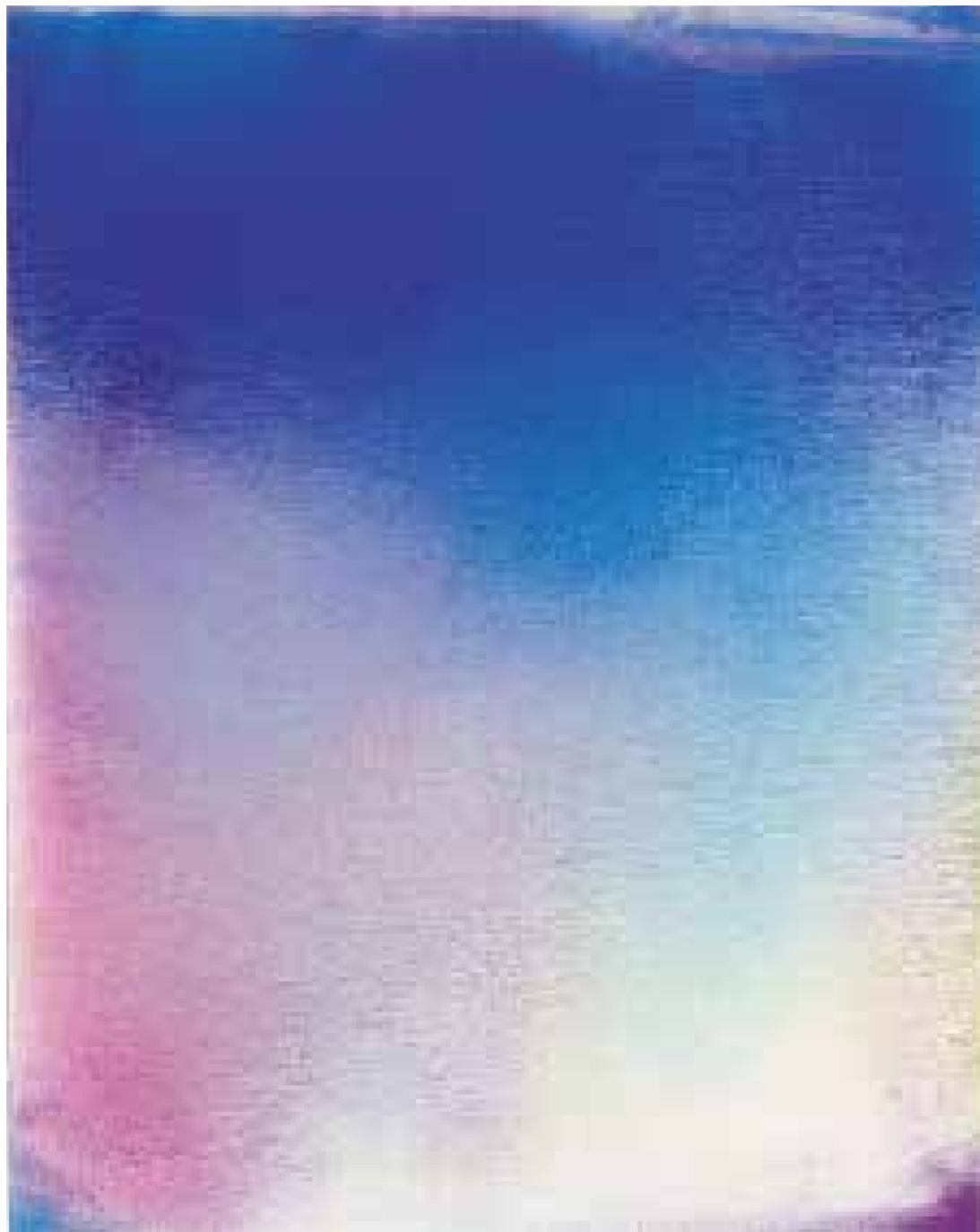
'UT (2082)' van Thorbjørn Bechmann is een van de werken van Enari Gallery, de jongste galerie op de KunstRAI.

Het is een duidelijk visitekaartje. Enari Gallery vist niet, zoals het gros van de gevestigde galleries, in de vijver van de Rijksakademie en De Ateliers. "Wij halen onze kunstenaars van Instagram, Artsy en andere digitale platforms," erkent Van Gemen. "Wij brengen internationale kunst-