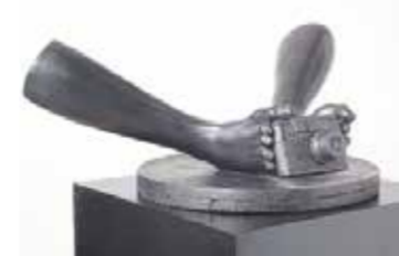
Boven: Thom Puckey, 'Optics'. Midden: Inup Park. Onder: Thom Puckey, '2 Feet and Camera'. Grote foto: Inup Park, 'Motion (loneliness, laziness, pressure)'.