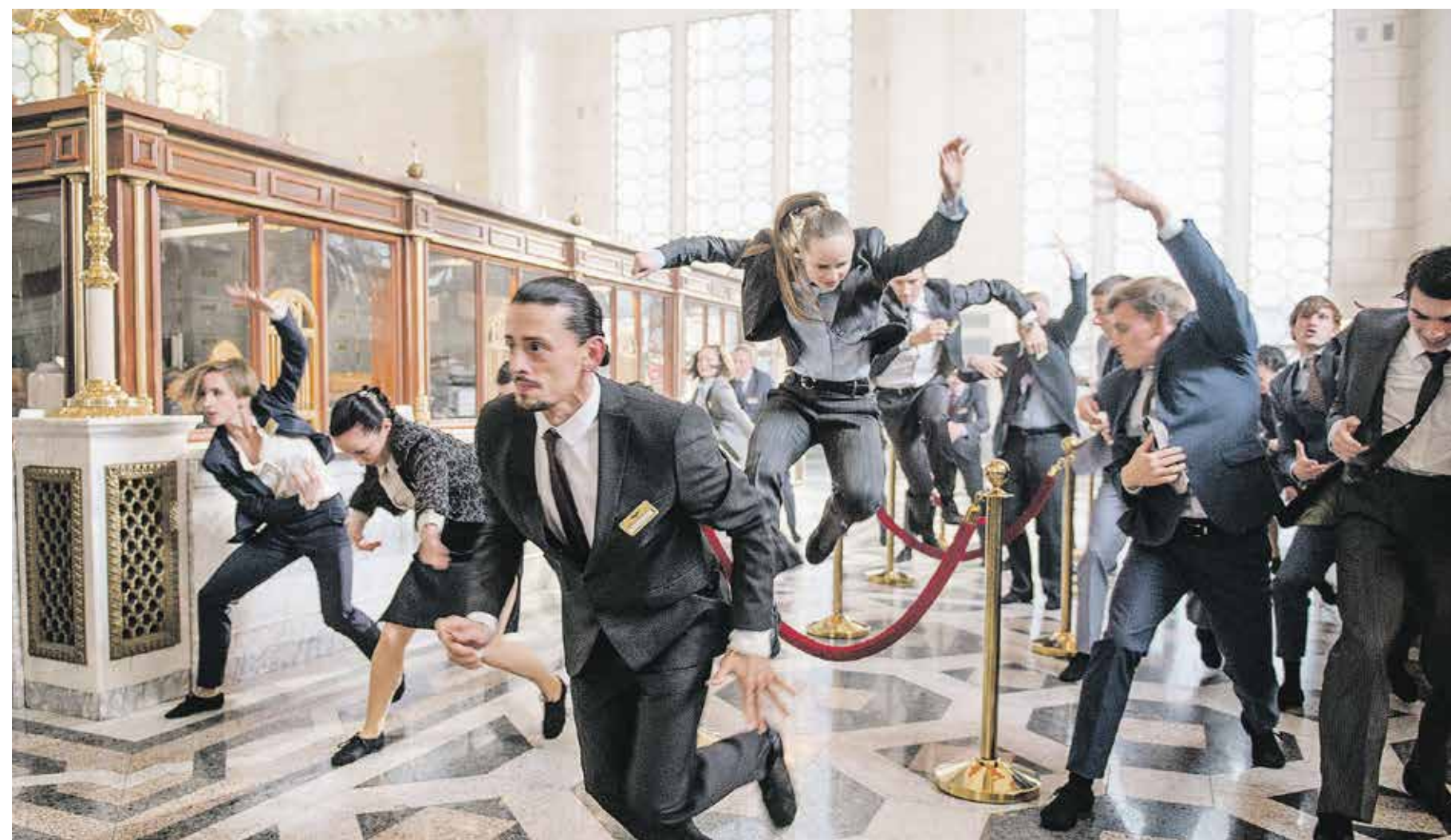
In Euphoria krijgen voor- en tegenstanders van het kapitalisme een podium.