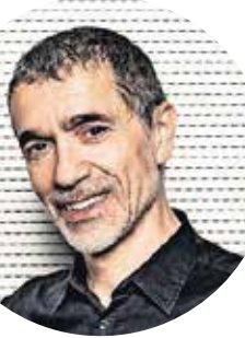
Regisseur Romeo Castellucci.

Een aardige vergoeding en twee vrijkaartjes worden geboden.