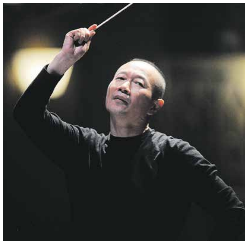
De Chinese componist Tan Dun werd wereldberoemd met zijn filmmuziek van Crouching Tiger, Hidden Dragon .

Een solo componeert Dun rustig voor water, of voor papier. Waterdruppels neemt hij uiterst serieus,