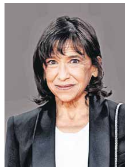
Kathryn Hunter

Hunter volgde een meer formele dramaopleiding aan de Royal Academy of Dramatic Art (RADA). Toen ze veertien jaar geleden bij Complicité kwam, was McBurney voor haar een openbaring. Die vorm van fysiek en dynamisch gedreven theater, de benadering van een verhaal vertellen door het collectief. Hunter: "Het is een cadeau voor het leven."